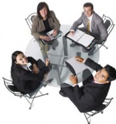
Отдел социального развития